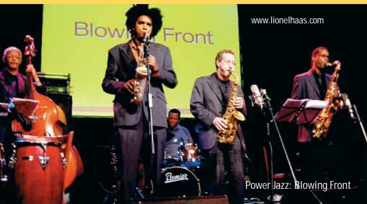
Power Jazz: Blowing Front