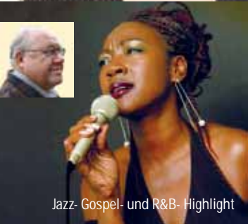
Jazz- Gospel- und R&B- Highlight

"Weder meine Zukunft noch meiner Vergangenheit zählen. Was ich getan habe, brachte mit sich, das was ich HEUTE bin. Das, was ich in der Zukunft tun werde, wird das Ergebnis von allen meinen Überlegungen und Taten von Heute sein. Musik hat keine Grenzen, deshalb singe ich was ich will. Denke mal darüber nach!" sagt der junge aus Kuba stammende Sänger, der seit kurzem in Berlin lebt. Mit seiner heissen Grupo serviert er uns SON und andere kubanische Stile.