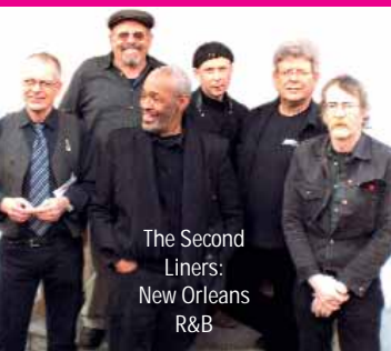
The Second Liners: New Orleans R&B