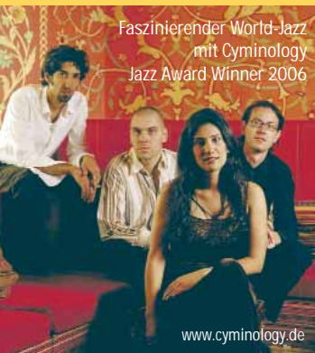
Faszinierender World-Jazz mit Cyminology Jazz Award Winner 2006