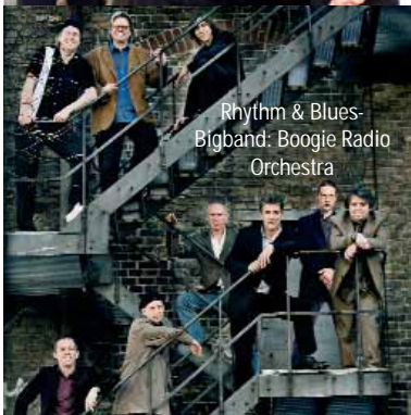
Rhythm & Blues-Bigband: Boogie Radio Orchestra