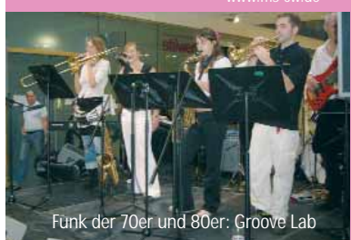
Funk der 70er und 80er: Groove Lab