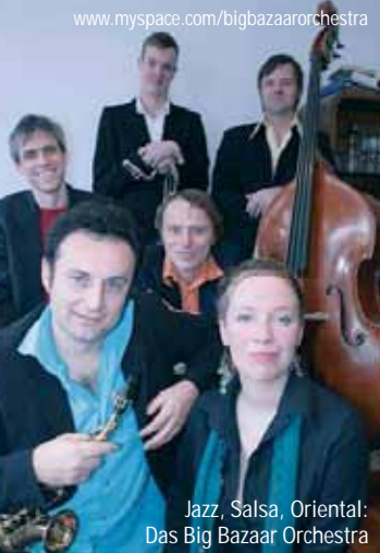
Jazz, Salsa, Oriental: Das Big Bazaar Orchestra