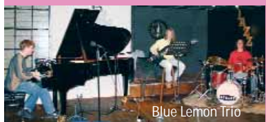
Blue Lemon Trio