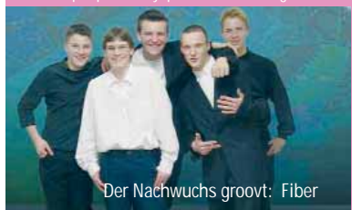
Der Nachwuchs groovt: Fiber

http://profile.myspace.com/christofgriese