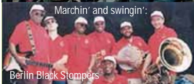
Marchin' and swingin':