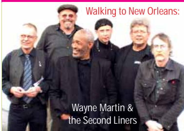
Walking to New Orleans: