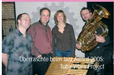
Überraschte beim Jazz Award 2005: Tuba-Vibes Project